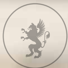
Global Brands Magazine Awards 2017