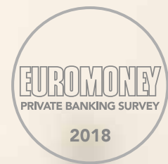
2018 Euromoney Private Banking Survey