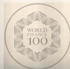
World Finance 100