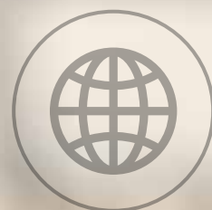
Global Finance Awards 2016