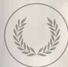
Sito Web dell'Anno 2016